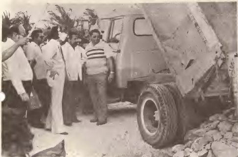
Durante Februari trabow a cuminsa cu construccion di pier pa piscadornan na Savaneta.

Nunca antes agricultura, cria y pesca a haya tanto atencion manera for di e Gobierno di Aruba actual.